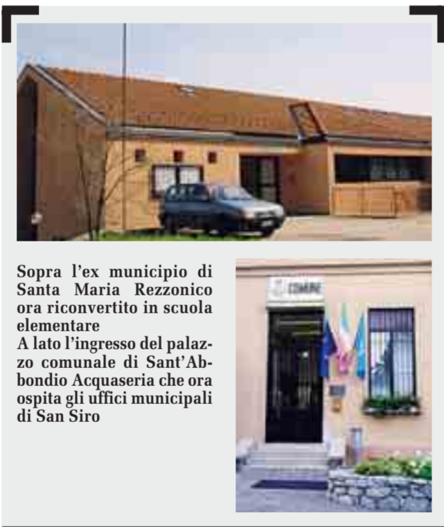
Sopra l'ex municipio di Santa Maria Rezzonico ora riconvertito in scuola elementare. A lato l'ingresso del palazzo comunale di Sant'Abbondio Acquaseria che ora ospita gli uffici municipali di San Siro

SAN SIRO (Gp. R.) Dal Primo gennaio 2003 sono scomparsi i Comuni di Santa Maria Rezzonico e Sant'Abbondio ed è nato San Siro. A distanza di quattro anni i due sindaci originari non nascondono la delusione.