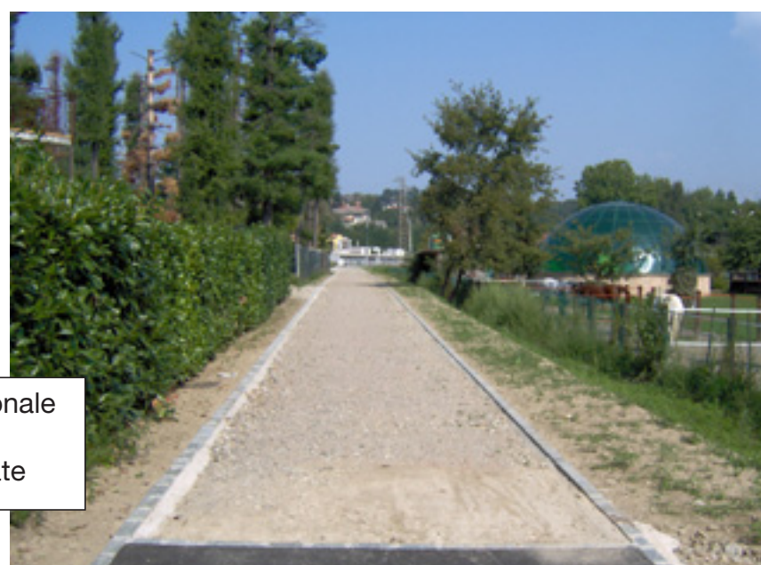
La nuova ciclopedonale tra la Via Giovio e il Cimitero di Lurate