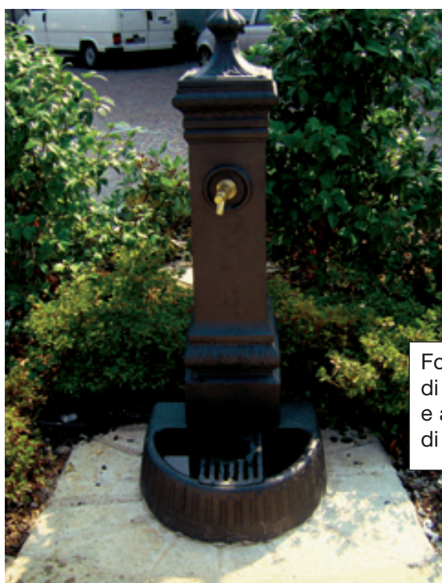
Fontanelle nella piazza di Via Roncoroni e ai giardinetti di Via Manzoni