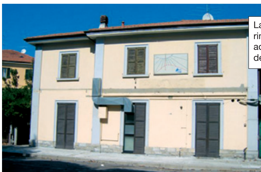
La vecchia stazione rimessa a nuovo adibita a sede della locale Pro Loco