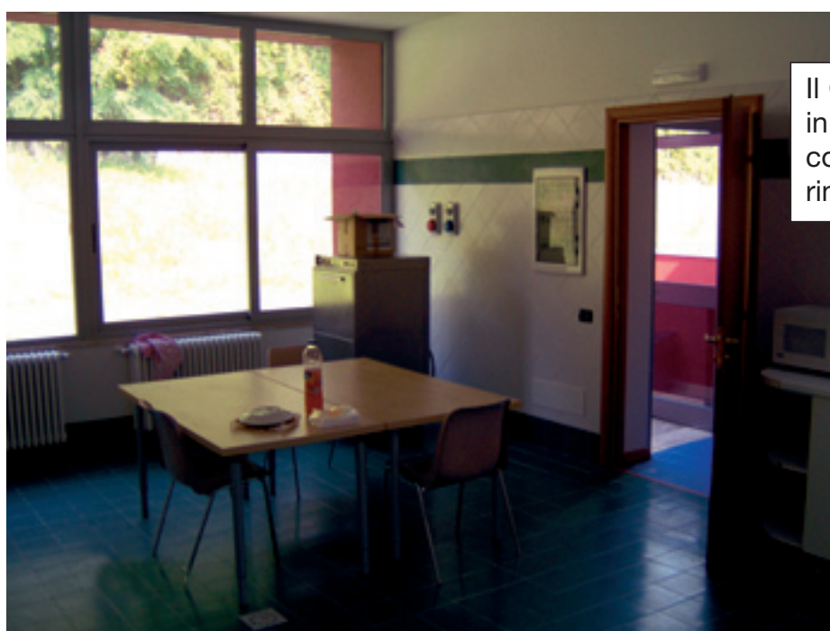
Il Centro Diurno Disabili in Via Monterotondo completamente rinnovato e ristrutturato