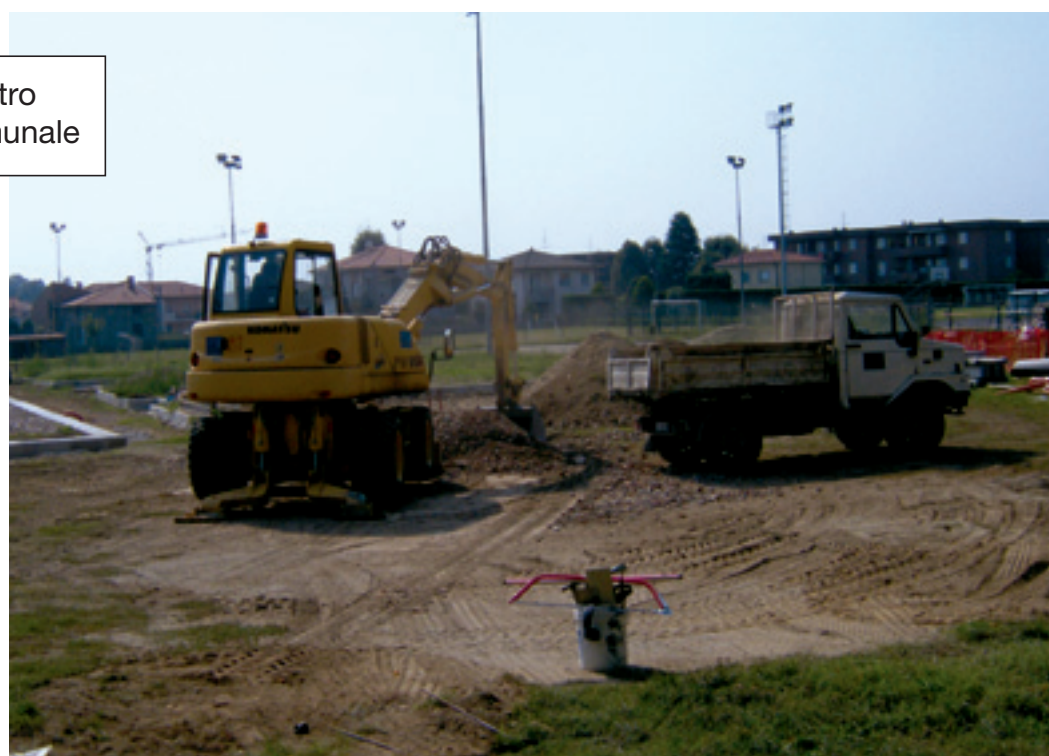
Lavori al centro sportivo comunale