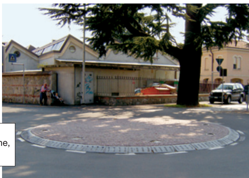
La nuova rotonda all'incrocio tra le Vie Unione, Stucchi e Leopardi