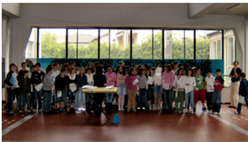
Bambini in festa alle scuole elementari in occasione delle celebrazioni del 25 aprile